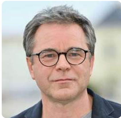
Guillaume de Tonquédec