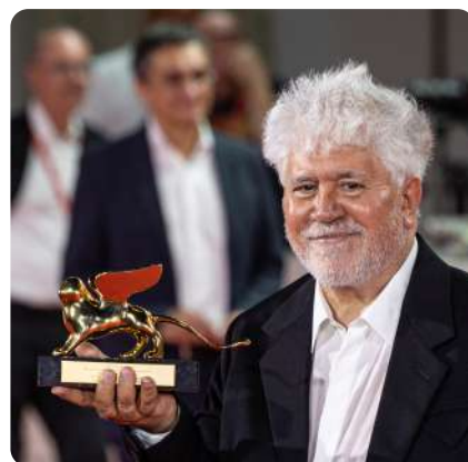
Pedro Almodovar - Lion d'or à Venise 2024

"La Chambre d'à côté" de Pedro Almodovar aborde la question du suicide en cas de maladie grave et incurable. Le film a obtenu le Lion d'Or à la Mostra de Venise en septembre 2024.